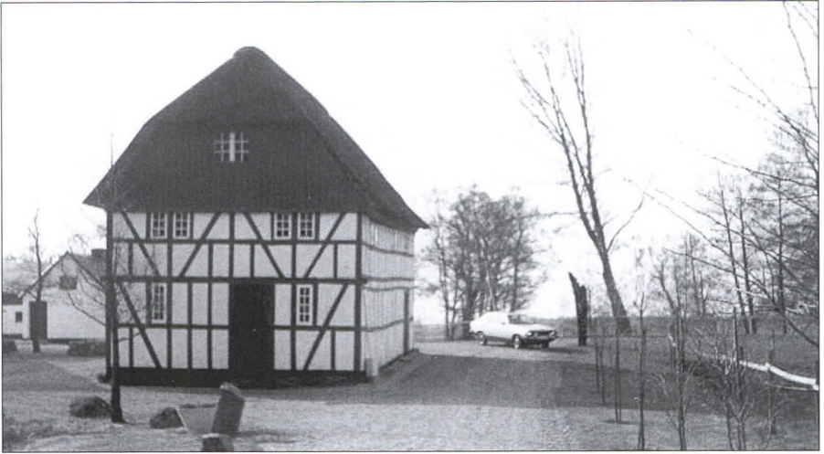
Møllen kørte sidste gang i år 1919/1920, derefter blev møllebygningen ændret til opbevaringsrum for korn i sække.