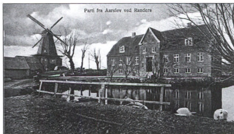
Aarslev Mølle. omkr. 1922 Gårdens hedder i dag Aarslevholm.