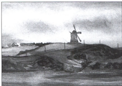
Essenbæk Mølle og "Essenbækgaarden"