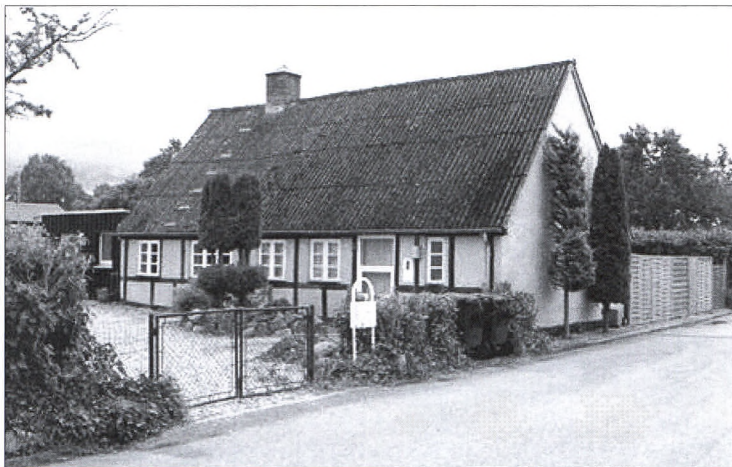
Møllerens gamle stuehus fra 1880 står der endnu på Gl. Ringvej 21.