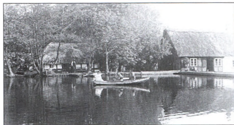
Volk Møllegaarden set fra havensiden. Gården nedbrændte i 1934.