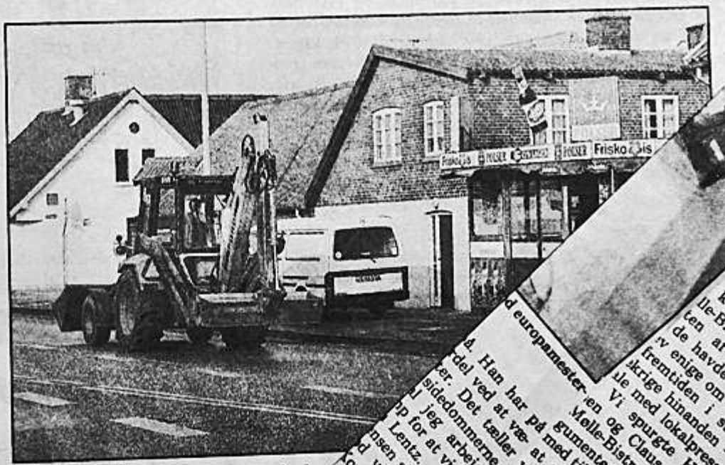
I aften holder Auning Handelsudvalg pølsevognen.