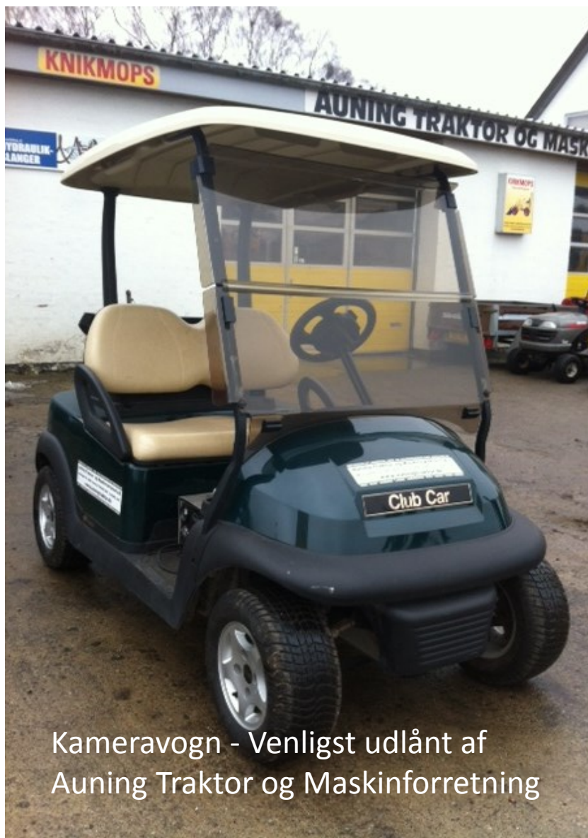
Kameravogn - Venligst udlånt af Auning Traktor og Maskinforretning