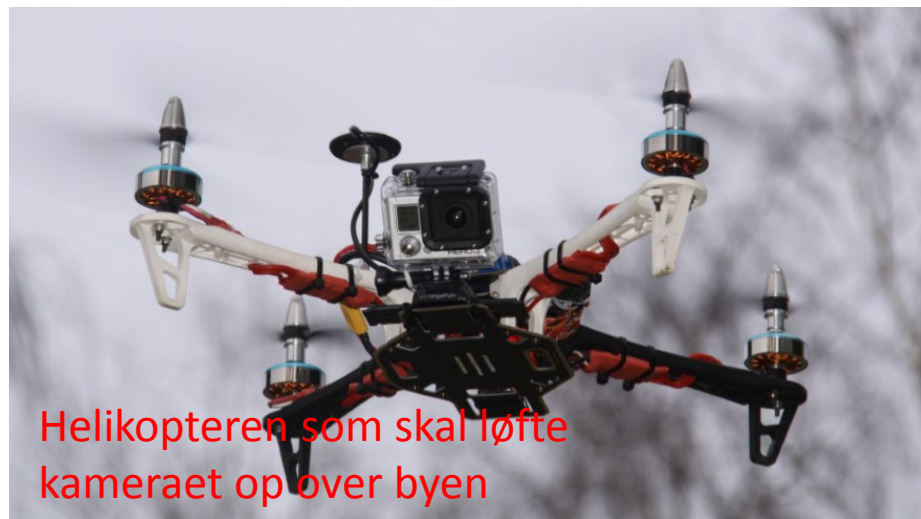
Helikopteren som skal løfte kameraet op over byen