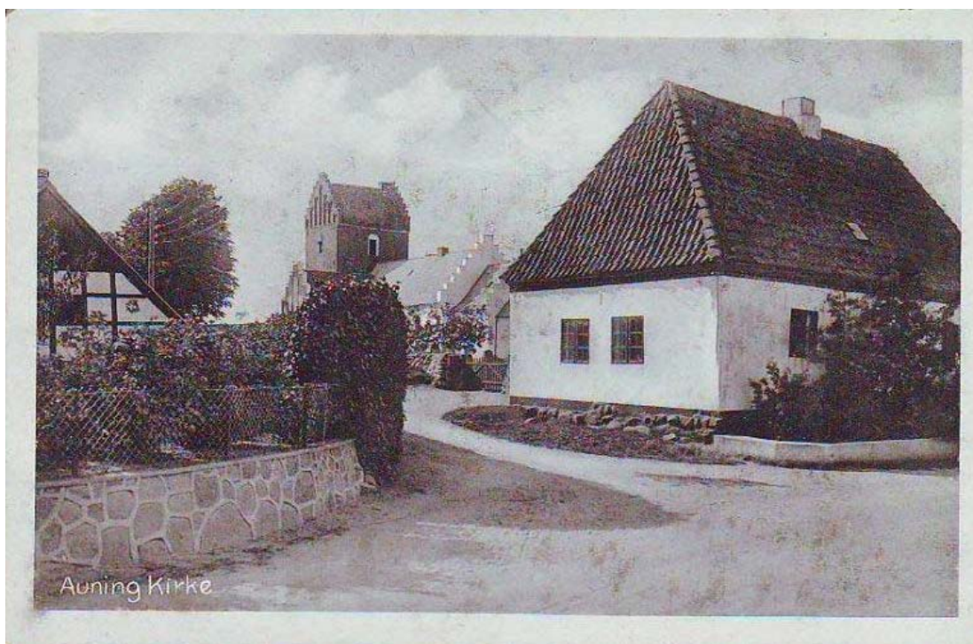
Postkort fra 1947