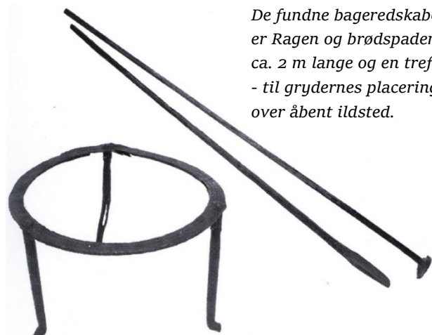
De fundne bageredskaber er Ragen og brødspaden, ca. 2 m lange og en trefod - til grydernes placering over åbent ildsted.

Under restaureringen fandt man et hemmeligt rum i huset. Ved at måle sig frem fra mur til mur opdagede man, at de indvendige mål ikke kunne stemme. Da man derefter på loftet brød brædderne op, kunne man kigge ned i et tilmuret rum, hvori man fandt den gamle bageovn næsten intakt. Det var en spændende sag, og man gav sig til at kigge rundt efter andre interessante ting og fandt således på hanebjælkerne de gamle bageredskaber. Den gamle ovn m.