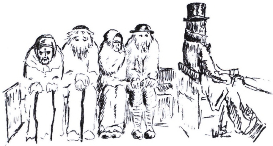
Fantasi over de gamles månedlige tur til Gl. Estrup

at bygningen skulle være bolig for. Ja, det sociale lå skam også gamle dages højintelligente adelspersoner på sinde, ofte meget mere end man måske tror.