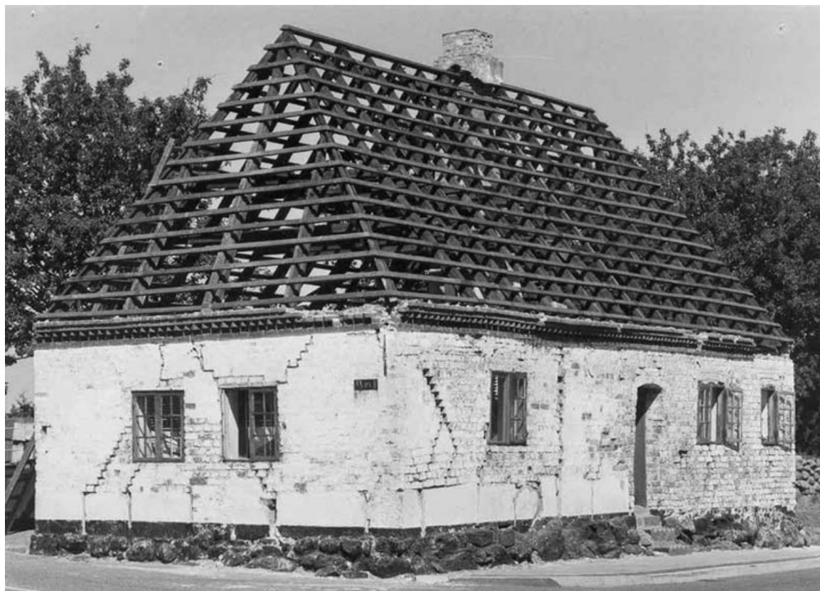
Det gamle hospital fotograferet under restaureringen.

Det gamle hospital, matr.nr. 34 Auning by og sogn, blev ved kgl. anordning i 1964 fredet i klasse B og blev således næst efter kirken det eneste fredede bygningsværk i Auning sogn. Den gamle bygning har indenfor det sidste års tid fået en restaurering, der var en kirke værdig, – i hvert fald er der ofret store summer på det lille arkitektonisk harmoniske hus på hjørnet af Kirkegade og Kirkevej.