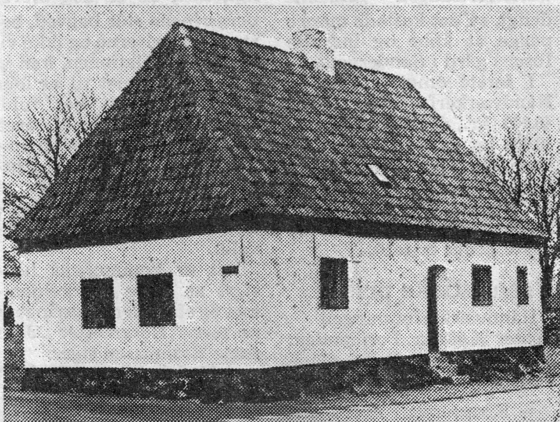
Det gamle ligkapel, der er fredet i klasse B, skal nu restaureres.

150.000 kr. fra staten. For 10 år siden, da det nye kapel blev bygget, var der mange røster fremme for at få det gamle kapel sløjfet, blandt andet da det ligger langt ud på hjørnet af Kirkegade og Kirkevej. Det viste sig da, at kapellet var fredet i klasse B i 1964 af Kulturministeriet efter indstilling fra det særlige bygningstilsyn, der har nært samarbejde med Nationalmuseet.