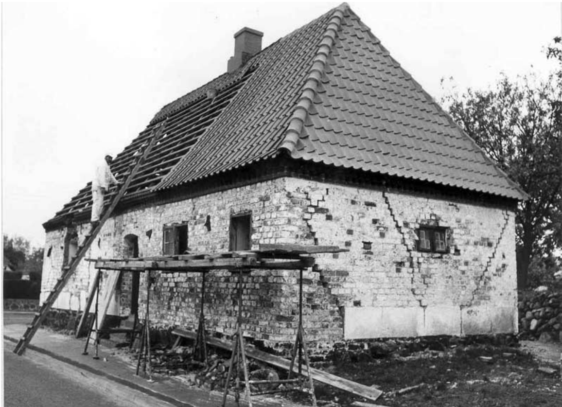
Det gamle Hospital fotograferet under restaureringen.

Nationalmuseets særlige bygningstilsyn listede og lokkede for Sønderhald kommune, således at kommunen indvilgede i at garantere vedligeholdelsen af bygningen i fremtiden, hvis Nationalmuseet ellers stort set betalte restaureringen, der var anslået til at ville koste ca. 150.000 kr.